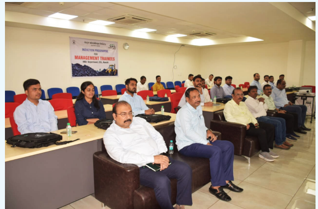
इंडक्शन प्रोग्राम का एक दृश्य

इस कार्यक्रम का आयोजन मानव संसाधन विकास विभाग एवं अधिकारी स्थापना विभाग द्वारा किया गया, जिससे प्रशिक्षुओं के लिए कोल इंडिया/सीसीएल में एक प्रभावशाली शुरुआत सुनिश्चित हो।