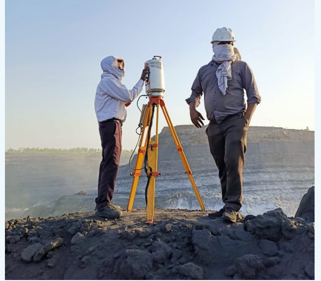
सतर्कता टीम के अधिकारियों द्वारा औचक निरीक्षण का दृश्य

सतर्कता विभाग द्वारा समय-समय पर औचक निरीक्षण एवं जाँच आदि के प्रयास किये जाते हैं तथा निवारक सतर्कता पर आधारित अभियान भी चलाये जाते हैं। इस पहल के फलस्वरूप संचालन, कार्य निष्पादन एवं गुणवत्ता में पारदर्शिता के साथ बेहतरी आएगी, जो इस वित्तीय वर्ष के निर्धारित कोयला उत्पादन लक्ष्य की पूर्ति में सहायक होगी।