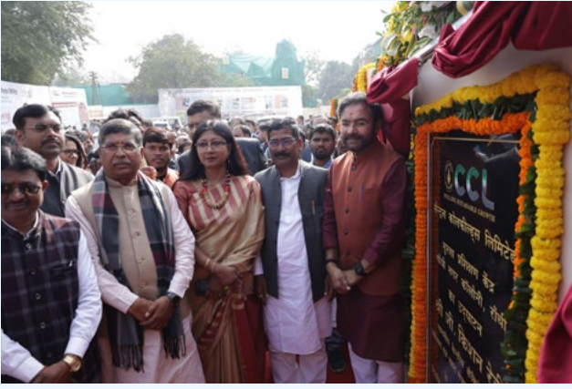
अन्य गणमान्यों के साथ माननीय कोयला एवं खान मंत्री, भारत सरकार श्री जी. किशन रेड्डी सीएस. ीएल कर्मियों के लिए चार बहुमंजिला आवासीय भवनों के निर्माण का शिलान्यास करते हुए