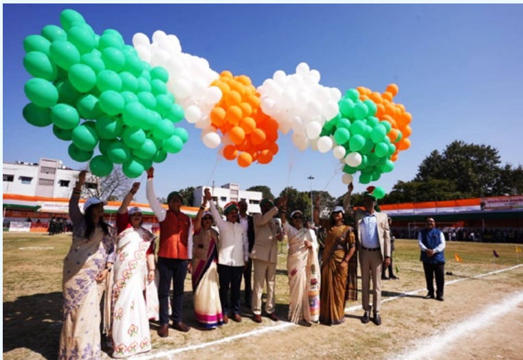
गणतंत्र दिवस के अवसर पर रंग-बिरंगा गुब्बारे उड़ते माननीय अतिथिगण