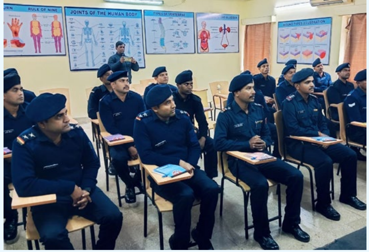
प्रशिक्षणरत एनडीआरएफ की टीम