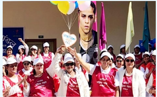
खेल दिवस के दौरान खिलाड़ियों के साथ अर्पिता महिला मंडल की सदस्याएँ

कार्यक्रम का समापन पुरस्कार वितरण समारोह के साथ हुआ, जिसमें सभी प्रतिभागियों को प्रयासों को सराहा गया और उन्हें पुरस्कृत किया गया। यह आयोजन फिटनेस, खेल और उत्सव का यादगार दिन