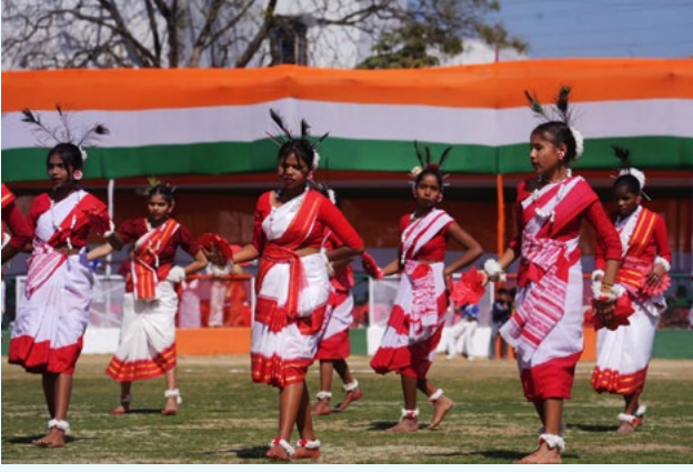
गणतंत्र दिवस के अवसर पर सांस्कृतिक कार्यक्रम का एक दृश्य

कैडेट्स ने 2024 में अंतरराष्ट्रीय स्तर पर 8 पदक जीते हैं। कंपनी के खेल योगदान के तहत महिला फुटबॉल टीम ने 63वें सुब्रतो कप में शानदार जीत हासिल की।