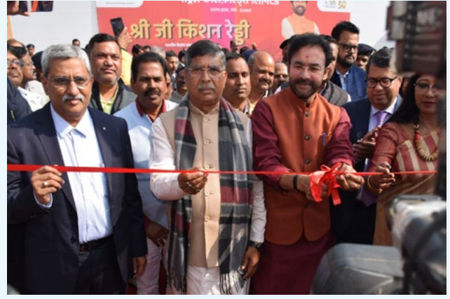
माननीय कोयला एवं खान मंत्री, भारत सरकार श्री जी. किशन रेड्डी अन्य गणमान्यों की उपस्थिति में गांधीनगर में सुरक्षा प्रशिक्षण केंद्र का उद्घाटन करते हुए