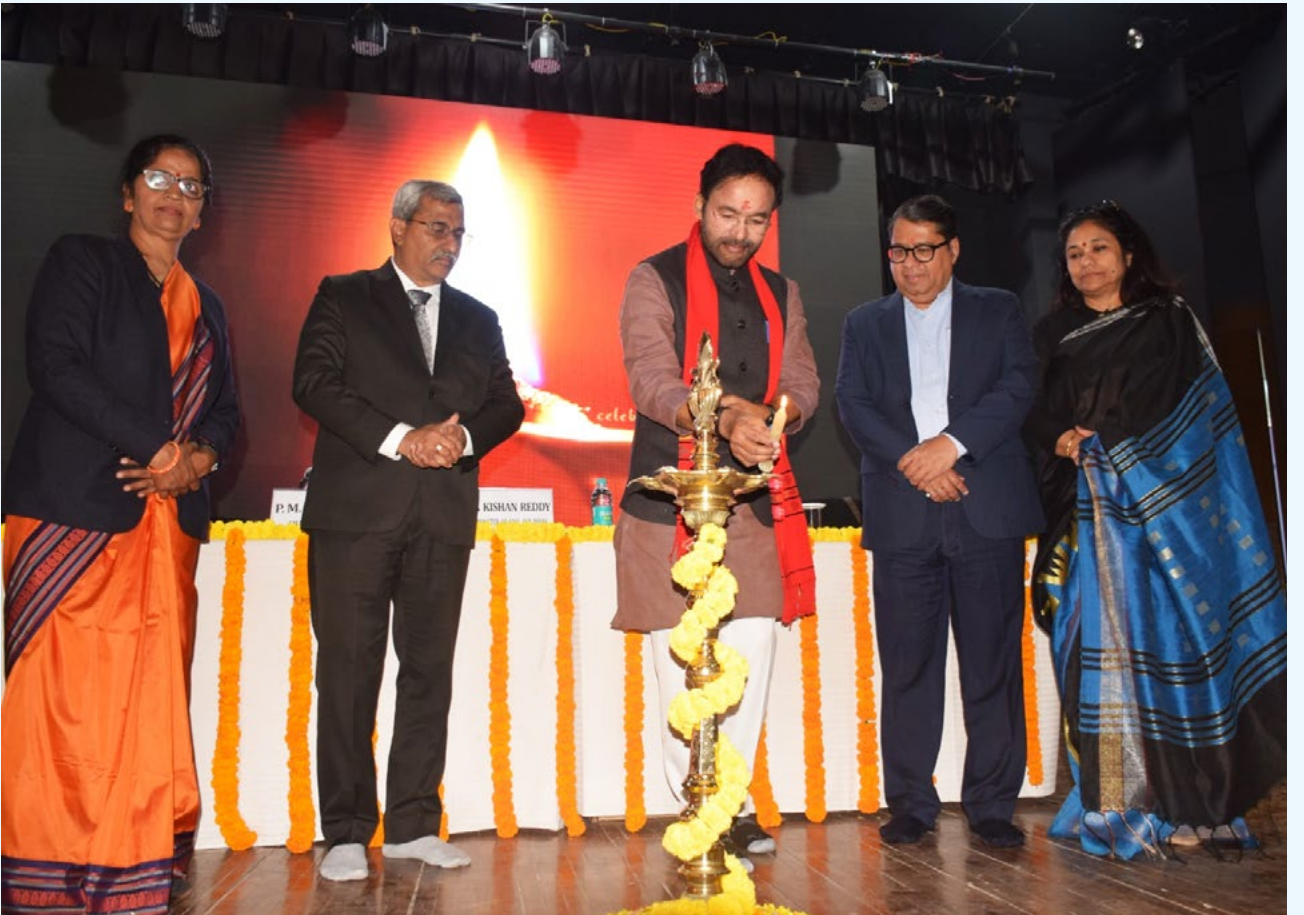
माननीय कोयला एवं खान मंत्री, भारत सरकार श्री जी. किशन रेड्डी अन्य गणमान्यों की उपस्थिति में आईआईसीएम, कोँके, राँची में दीप प्रज्वलित कर कार्यक्रम का शुभारंभ करते हुए

यह आयोजन न केवल कोयला क्षेत्र में महिलाओं की बढ़ती भागीदारी को रेखांकित करता है, बल्कि उन्हें नई ऊंचाइयों तक पहुंचने के लिए प्रेरित भी करता है। IICM के इस पहल और माननीय मंत्री के संदेश से युवा प्रतिभागियों को अपने कार्यक्षेत्र में सर्वोत्तम योगदान देने की प्रेरणा मिली।