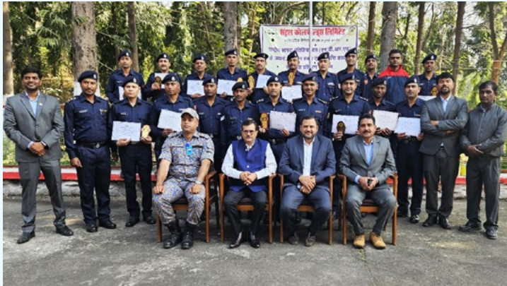
सीसीएल अधिकारियों के साथ एनडीआरएफ की टीम

अब खनन आपदाओं के दौरान राहत और बचाव कार्यों में महत्वपूर्ण भूमिका निभाने के लिए पूरी तरह से तैयार हैं। उन्होंने सीसीएल और एनडीआरएफ के संयुक्त प्रयासों की सराहना की।