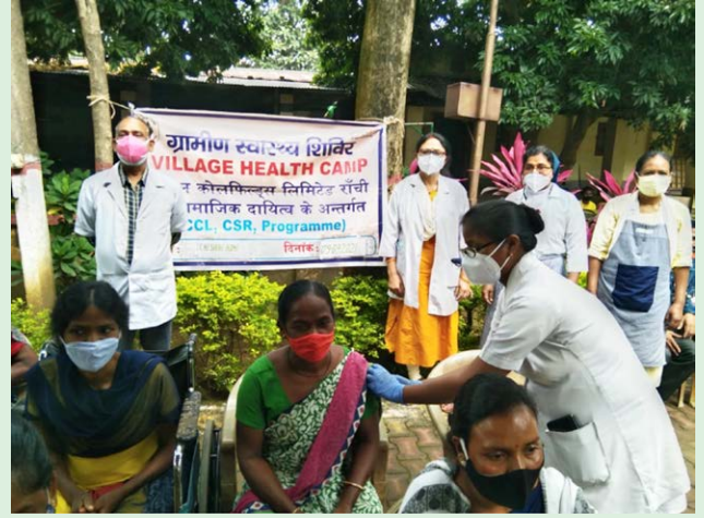
बरियातू, रांची स्थित 'चेशायर होम' में राज्य सरकार एवं सीसीएल के सहयोग से कोविड टीकाकरण का एक दृश्य

ज्ञातव्य हो कि सीसीएल प्रबंधन द्वारा चेशायर होम में समय-समय पर चिकित्सा शिविर का आयोजन किया जाता रहता है साथ ही अन्य सहायता भी उपलब्ध करायी जाती है।