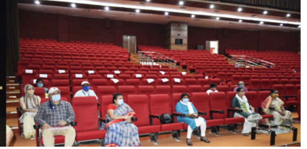
आयोजित कैम्प में टीकाकरण का लाभ उठाते सीसीएल कर्मी

झारखण्ड सहित पूरे देश कोरोना महामारी से प्रभावित है। सीसीएल परिवार कोरोना के खिलाफ लड़ाई में निरंतर प्रयासरत है। कोविड-19 के संक्रमण को रोकने के उद्देश्य से दरभंगा हाउस, राँची स्थित 'डिस्पेंसरी' में दो दिवसीय - 07 मई एवं 10 मई, 2021 को टीकाकरण कैम्प का आयोजन किया गया, जिसमें 45 वर्ष की आयु से ऊपर सीसीएल कर्मियों के लिए वैक्सीन लगाया गया।