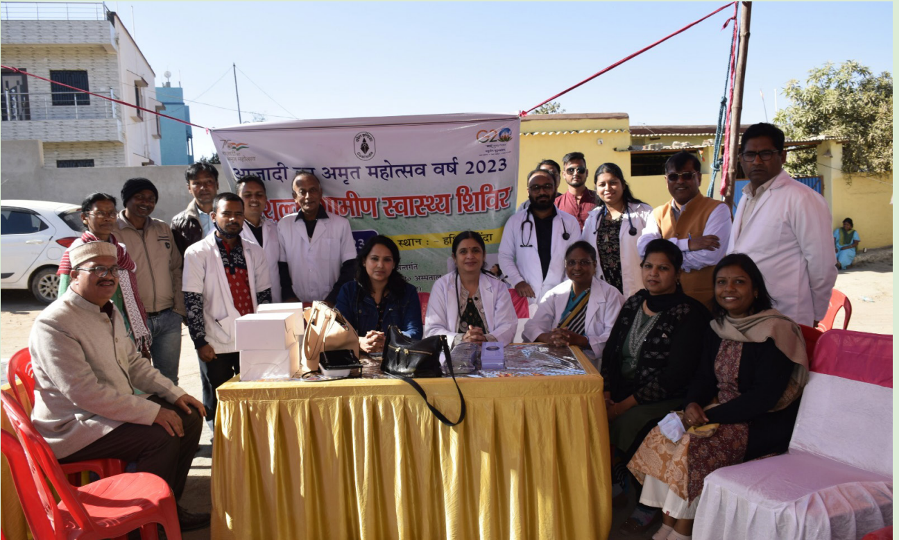
ग्रामीण स्वास्थ्य शिविर में उपस्थित सीसीएल के चिकित्सकगण एवं पारामेडिकल स्टाफ

दिनांक 03 फरवरी को राँची के हाथीगोंडा में सीसीएल द्वारा आजादी का अमृत महोत्सव के अंतर्गत 'ग्रामीण स्वास्थ्य शिविर' का आयोजन किया गया। इस शिविर में 150 ग्रामीणों के हाइपरटेंशन तथा मधुमेह की निःशुल्क जांच की गई।