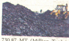
730.87 MT (Million Ton) in 2019-20 to 778.19 MT in 2021-22, achieving a growth of 6.47 per cent.

India's domestic coal production has shown impressive growth during the past few years and this rise in output has helped the nation to check the import of fossil fuel considering the government said on