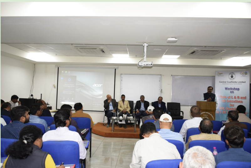
कार्यशाला का एक दृश्य

कार्यशाला में पावर पॉइंट प्रेजेंटेशन के माध्यम से उपरोक्त विषय संबंधी सूचनाओं को साझा किया गया। कार्यक्रम को सफल बनाने में एचआरडी तथा भूमि एवं राजस्व विभाग के कर्मियों की महत्वपूर्ण भूमिका रही।