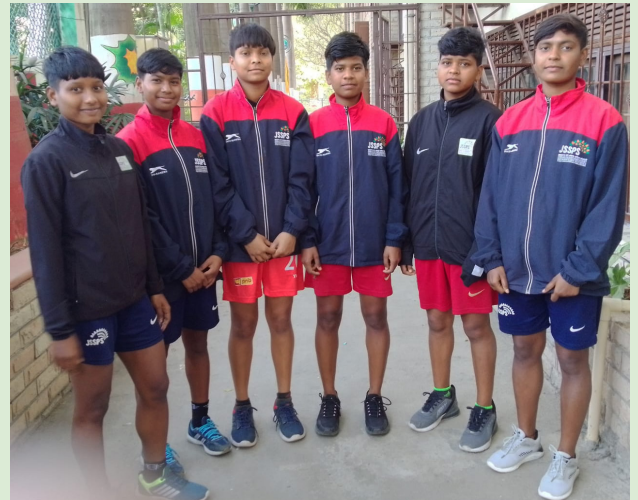
जेएसएसपीएस के चयनित महिला कैडेट्स

झारखंड स्टेट स्पोर्ट्स प्रमोशन सोसाइटी (जेएसएसपीएस) सीसीएल और झारखंड राज्य सरकार की संयुक्त पहल है। इसके अंतर्गत राज्य भर से प्रतिभावान खिलाड़ियों का चयन कर विशेषज्ञ प्रशिक्षकों द्वारा अंतरराष्ट्रीय स्तर का प्रशिक्षण दिया जाता है। खेलगांव स्थित इस संस्था द्वारा निःशुल्क आवासीय सुविधा उपलब्ध कराई जाती है। गौरतलब हो कि जेएसएसपीएस के खिलाड़ियों ने सैकड़ों राष्ट्रीय और अंतरराष्ट्रीय पदक जीत कर राज्य और देश को गौरवान्वित किया है। सीसीएल