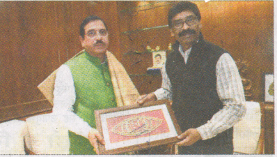
मुख्यमंत्री हेमन्त सोरेन (बाएँ) और केंद्रीय कोयला तथा खान मंत्री प्रह्लाद जोशी (दाएँ) ने सीसीएल और ईसीएल के साथ समझौते पर हस्ताक्षर किए।

फ्रीडम फाइटर संवाददाता रांची : मुख्यमंत्री हेमन्त सोरेन एवं केन्द्रीय कोयला तथा खान मंत्री प्रह्लाद जोशी की गरिमामयी उपस्थिति में झारखंड सरकार एवं कोल इंडिया भारत सरकार की अनुपंगी कंपनी सेंट्रल कोयलाफील्ड्स लिमिटेड (सीसीएल) एवं ईस्टर्न कोयलाफील्ड्स लिमिटेड (ईसीएल) के साथ दो महत्वपूर्ण समझौता ज्ञापन पर हस्ताक्षर (एम.ओ.यू.) सम्पन्न हुआ। इस दौरान बताया गया कि रांची विश्वविद्यालय परिसर मोरहाबादी रांची में सेंट्रल कोयलाफील्ड्स लिमिटेड (सीसीएल) द्वारा सी.एस.आर. पर से उपलब्ध करायी जानेवाली राशि से 5000 अध्ययनार्थी छात्र-छात्राओं की छात्रवृत्तियाँ प्रदान की जाएगी।