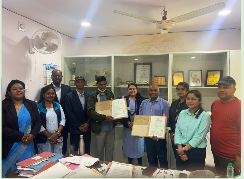
समझौता ज्ञापन का एक दृश्य

प्रथम समझौता ज्ञापन में घायल जानवरों के बचाव एवं उपचार के लिए 24×7 एंबुलेंस की व्यवस्था की जाएगी। इसके अतिरिक्त भी घायल जानवरों के पुनर्वास तथा लोगों के बीच ‘रेबीज रोग’ से बचाव संबंधित जागरूकता फैलाई जाएगी। इस पूरे अभियान में सीसीएल द्वारा निगमित सामाजिक दायित्व (सीएसआर) के अंतर्गत 37.44 लाख व्यय किया जाएगा।